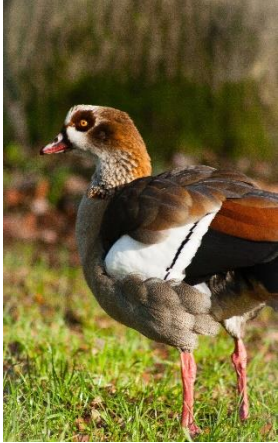
Immer häufiger anzutreffen. Gefangenschaftsflüchtlinge der Nilgans bildeten Populationen, die sich nun entlang dem Rhein ausbreiten.

Grundsätzlich sind Veränderungen in der Ausbreitung einer Art natürliche Prozesse, die unterschiedliche Ursachen haben können. Jedoch sind grössere Ausbreitungsveränderungen natürlicherweise sehr selten. In Zusammenhang mit dem wachsenden weltweiten Handel hat das Auftreten von gebietsfremden Arten über ihre natürlichen Grenzen hinweg stark zugenommen. Nicht jedes Individuum, welches sich in fremde Gefilde verliert, schafft es auch sich zu etablieren. Als Neozoen werden deshalb Tierarten bezeichnet, die ab 1492 unter direkter oder indirekter Mitwirkung des Menschen in ein ihnen unzugängliches Faunengebiet gelangt sind und dort neue Populationen aufbauen. Im Kanton Zürich leben mittlerweile eine Vielzahl etablierter Neozoen unbemerkt und ohne Probleme für die einheimische Fauna zu verursachen. Es gibt aber auch einige Arten, die für die einheimische Fauna problematisch werden können, da sie durch ihr teilweise aggressives Verhalten einheimische Arten konkurrenzieren und verdrängen können.