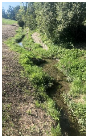
Revitalisierter Bachabschnitt

Die Fischerei- und Jagdverwaltung würde sich freuen, wenn auch von Fischer und Fischerinnen Projekte eingereicht werden. Weitere Informationen und Beispiele finden Sie im Web unter «Vielfältige Zürcher Gewässer – Kanton Zürich» .